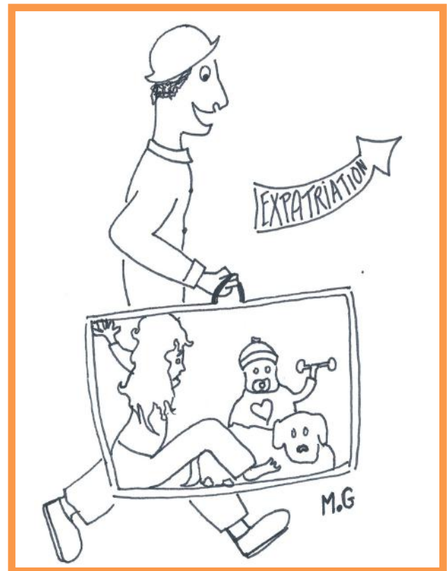
Allez, hop ! On se fait la malle !