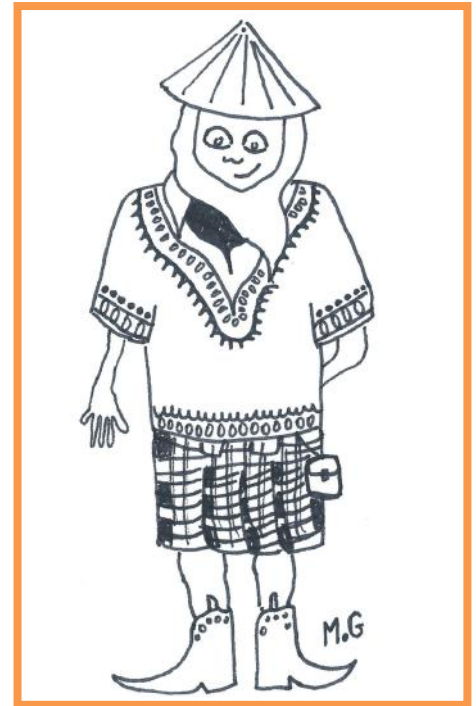
L'étudiant M2i dans toute sa splendeur

Ces deux petits « i » – interculturel et international – cachent de grands concepts à l'image de cette classe de master 2 de Nanterre qui cache de grands talents en devenir. La famille M2i est riche de par ses différences qui en font sa force. Les multiples cultures qui la composent depuis 10 ans forment une communauté interculturelle créative qui sait mener à bien des projets de grande envergure, main dans la main. C'est un bel échantillon de tolérance et de curiosité, à prendre exemple. M2i, one world, one family.