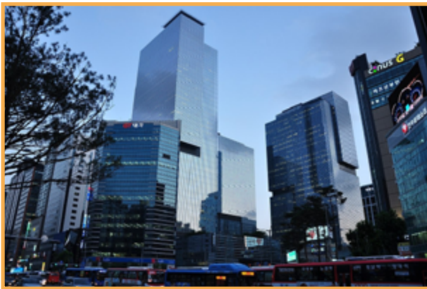
Siège social de Samsung en Corée du Sud

Cette stabilité, tant convoitée par les Coréens, représente une réussite de vie.